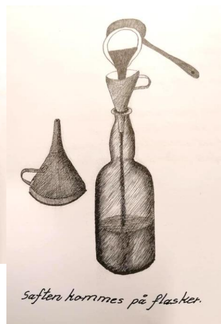
Saften kommes på flasker.