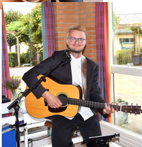
Daugaard leverede hyggemusik