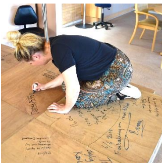
Og de skulle selvfølgelig skriv på scenen bagefter